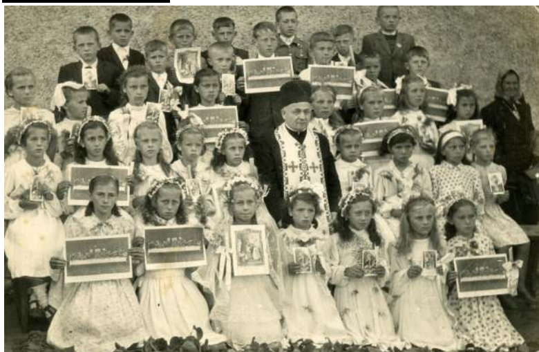
I Komunia Święta w Chrzanowie