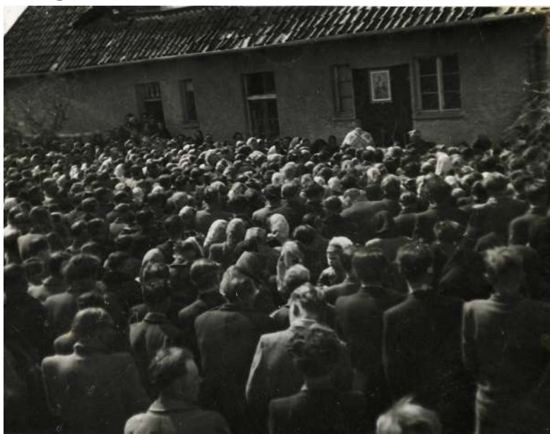
Jeden z Chrzanowskich odpustów, na które przybywały tłumy wiernych