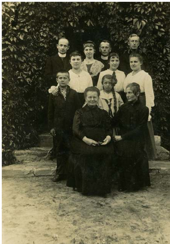
Ks. Ripecki wikariuszem