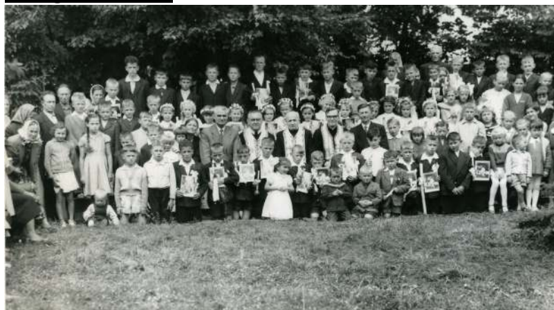
I Komunia Święta lata 50- te