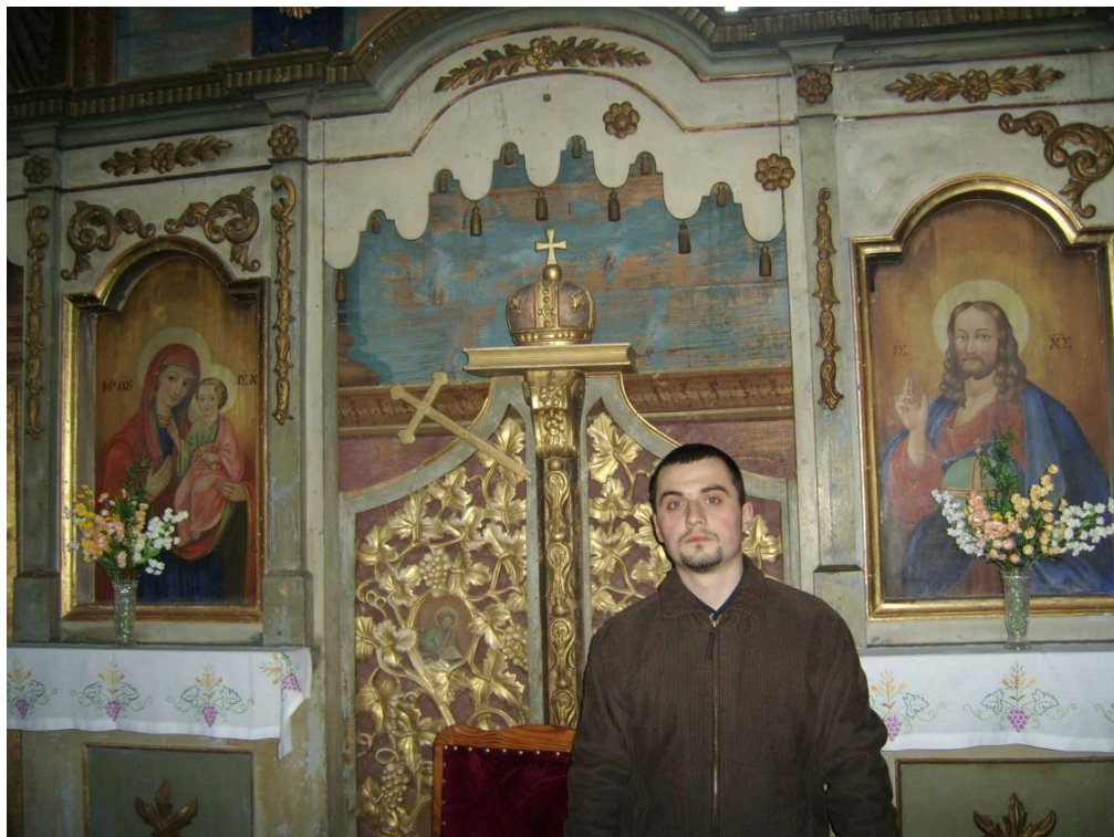
Fragmet Ikonostasu cerkwi w Liskach (Rajskie wrota oraz ikony Chrystusa i Bogarodzicy); dziś umieszczone po lewej stronie prezbiterium (na zdjęciu widoczny jest autor niniejszej pracy).